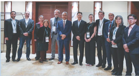
Iran Energy Efficiency Conference

انجمن مدیریت مصرف انرژی ایران به منظور گسترش و پیشبرد و ارتقای علمی و فنی مدیران و کارشناسان و توسعه کیفی نیروهای متخصص و بهبود بخشیدن به امور آموزشی و پژوهشی در زمینه‌های مدیریت مصرف انرژی، تشکیل گردید و در این راستا با انجام تحقیقات علمی و فرهنگی در سطح ملی و بین‌المللی با محققان و متخصصان که به گونه‌ای با علوم مرتبط با مقوله انرژی و مدیریت مصرف انرژی سروکار دارند ارتباط برقرار کند و انجمن در چشم‌انداز خود با ارائه آموزش‌ها و تحقیقات بتواند در بهینه سازی مصرف انرژی و کاهش تلفات انرژی در کشور سهیم بوده و نیروهای انسانی متخصص و کارآزموده که ضمن آشنایی بتوانند فناوری‌های جدید بهینه سازی مصرف انرژی در کشور را اجرا و پیاده نمایند، فعالیت می‌نماید.