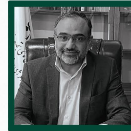
جناب آقای مهندس کمانی معاون محترم وزیر نیرو و رئیس سابقا