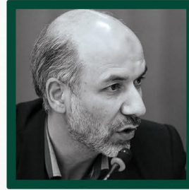
جناب آقای مهندس محرابیان وزیر محترم نیرو