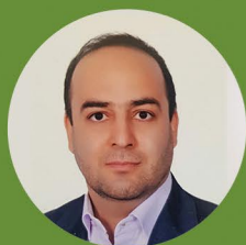
آقای دکتر شهر روز زمانی

رئیس محترم گروه ریلی امور راه و ترابری سازمان برنامه و بودجه کشور