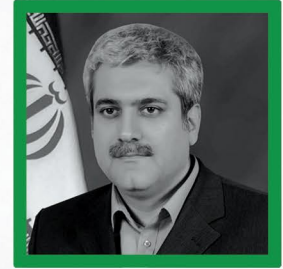
جناب آقای دکتر ستاری معاون علمی و فناوری رئیس جمهور