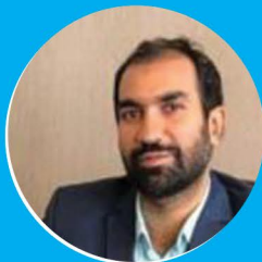
آقای دکتر علی ملکی

مشاور محترم وزیر اقتصاد و رئیس ستاد هماهنگی طرح باز توزیع یارانه بنزین